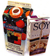
Envases de leche y otras bebidas (no envases con lámina interior de aluminio)