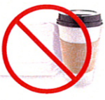
Envases de poliestireno y envases y vasos para comida rápida