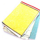
Papel de oficina blanco o pastel