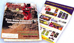
Revistas y catálogos