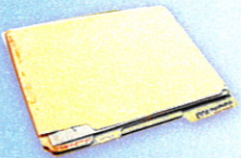
Folders y carpetas