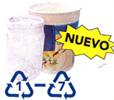
Envases plásticos #1-7 (no tapas, no #7 PLA compostables)