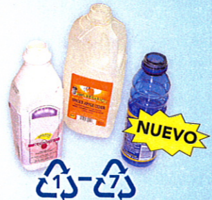
Botellas plásticas #1-7 (no tapas, no #7 PLA compostables)