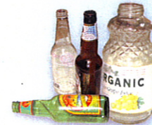
Botellas de vidrio