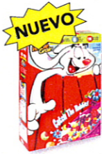
Cajas de papel cartón