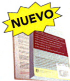
Libros de tapa blanda