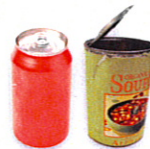
Latas (no aplastar)